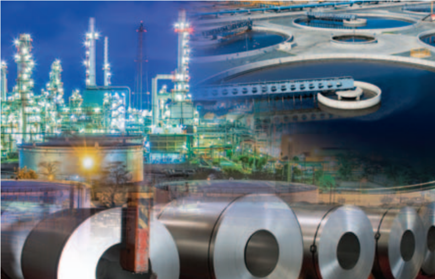
Die iQ Plattform ermöglicht die vollständige Integration von Steuerung und Kommunikation.