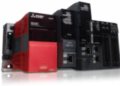
Mehrere CPUs auf einen Baugruppenträger

Die iQ Plattform basiert auf der Performance der Hochleistungs-SPS von Mitsubishi Electric, ergänzt durch eine große Auswahl an E/A-, Sonder- und Netzwerkmodulen. Diese anpassungs- und leistungsfähige Steuerungsplattform ermöglicht Unternehmen einen strategischen Zugang zu Automation und Steuerung, indem sie die volle Integration der Steuerungsebene in die Leitebene zulässt.